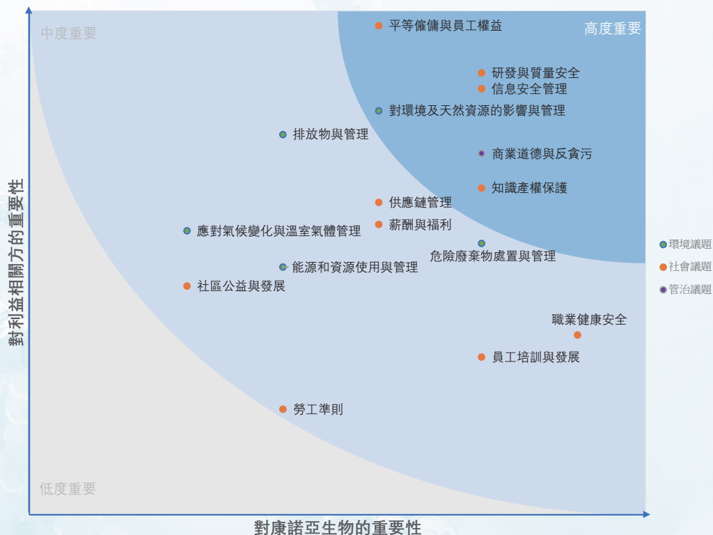
康諾亞重要性矩陣圖