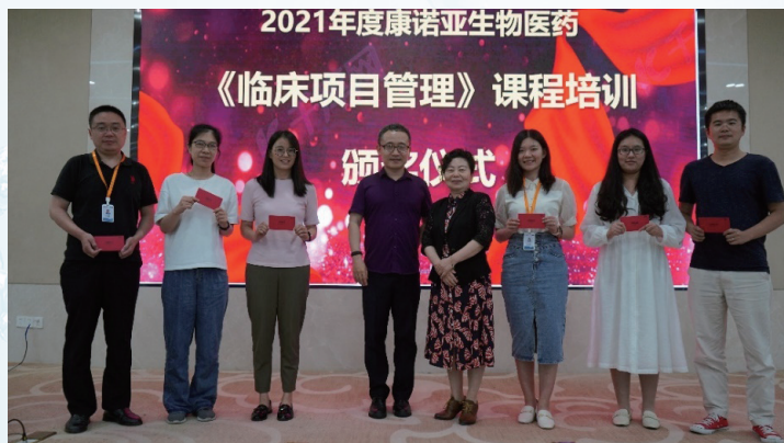
臨床項目管理培訓