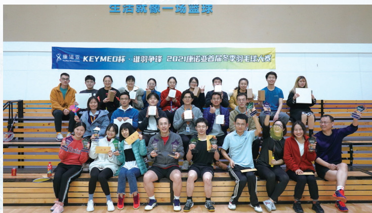
康諾亞2021年度羽毛球賽現場合照

康諾亞致力於為員工打造健康舒適的工作環境，並通過開展各種豐富的員工活動，幫助員工平衡工作和生活。我們積極組織各類體育及團隊建設活動，例如通過舉辦2021年度羽毛球賽，幫助員工增強體質、緩解工作壓力；組織員工生日派對、發放節日禮品，提升員工幸福感。此外，本公司照顧特殊群體，為女性職工設立母嬰室等特殊關愛措施；對困難員工開展幫扶、慰問，積極營造樂觀、開放、健康、和諧的工作生活氛圍。