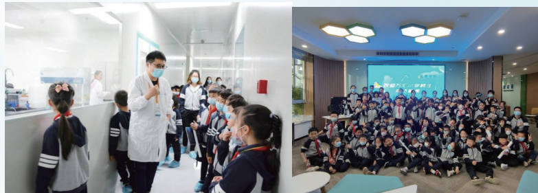
學校學生參觀康諾亞成都總部

康諾亞積極主動探尋一切能為當地社區帶來正向幫助的機會，將企業社會責任牢記於心，關切當地社區群眾的需求，專注社區健康、教育領域的發展，積極組織員工開展健康公益活動，以弘揚企業公益精神。2021年7月，康諾亞為成都高新區教育文化和衛生健康局舉辦的「高新綠道優跑賽」活動捐款10,000元，為倡導全民運動、健康生活獻出自己的一份力量。本公司亦高度重視青少年健康教育，2021年4月，我們組織成都萬匯小學參觀了康諾亞總部。在參觀活動上，面對各式各樣的高科技設備和工藝流程，學生們對生物與醫學知識充滿了好奇與探索慾。本公司安排專業人員在實驗室全程引導，通過科普、問答等環節，有效的激發了學生們的學習熱情。此次活動使學生們收穫滿滿，達到了知識普及的目的。