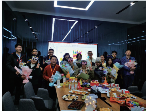
公司為員工舉辦生日派對